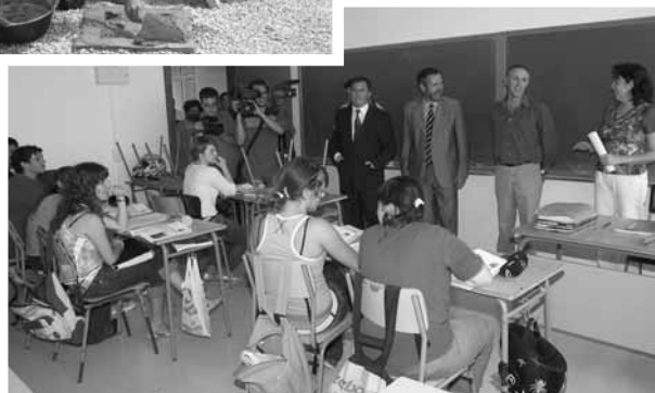
Inauguració de la reforma i ampliació de l'IES sa Pobra a Can Peu Blanc

Al llarg de la jornada, el batle i el conseller d'Educació també procediren a la inauguració oficial de les obres d'ampliació i reforma de l'Institut de Can Peu Blanc, que han inclòs l'esbucament d'una part de l'edifici i una reforma interna dels