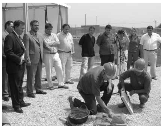
Primera pedra del nou col·legi públic sa Pobra

Amb aquest nou centre, la població escolar de sa Pobra disposarà de la cinquena escola d'Educació Primària per a una població lleugerament superior als 12.000 habitants. L'objectiu d'aquesta nova infraestructura educativa és intentar pal·liar al màxim el perill de massificació que, pel que fa a la població escolar, s'havia enregistrat a sa Pobra durant els darrers anys. Per la seva part, el consistori pobler ha aportat el solar on s'ubicarà el nou