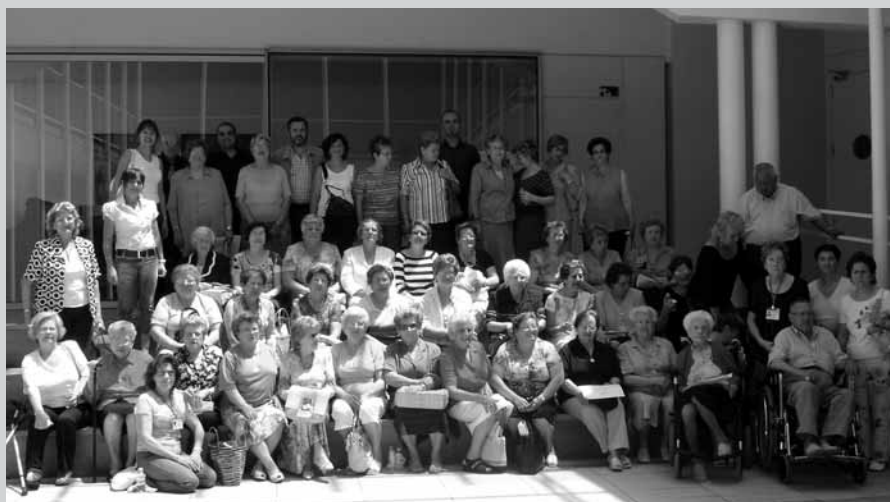
El passat 13 de juny va tenir lloc la festa de fi de curs dels grups de memòria i els d'habilitats socials que organitzen s'Institut i l'Ajuntament, i que tenen per objectiu millorar les condicions de vida de la gent gran.

espais disponibles, que a partir d'ara acolliran un total de 20 unitats d'ESO i 6 de Batxillerat. El projecte de reforma i ampliació de l'institut pobler ha suposat una inversió total de prop de 3.800.000 euros.